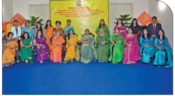
২৬ ডিসেম্বর ২০১৪ তারিখে বাওয়া প্রতিনিধিদল এবং সীপকস/চিলাড্রেন ক্লাবের পরিচালনা পর্ষদ এর আলোক চিত্র।