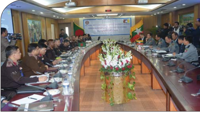
১৭ ডিসেম্বর ২০১৪ তারিখে পিলখানাস্থ বিজিবি সদর দপ্তরে অতিরিক্ত মহাপরিচালক বিজিবি এবং ডেপুটি চিফ অব মায়ানমার পুলিশ ফোর্স এর মধ্যে সীমান্ত সম্মেলন শুরু হয়।