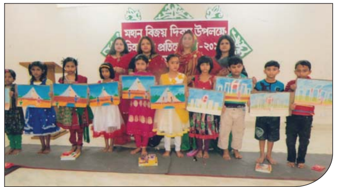
১৬ ডিসেম্বর ২০১৪ তারিখে চিত্রাংকন বিভাগের প্রতিযোগীদের মাঝে সহ-সভানেত্রী ও অন্যান্য ম্যাডামগণ উপ-শাখা সীপকস, সিলেট।