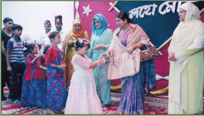
২৩ ডিসেম্বর ২০১৪ তারিখে উপ-শাখা সীপকস, বিজিটিসিএন্ডএস এর চিলড্রেন ক্লাব কর্তৃক আয়োজিত সাংস্কৃতিক অনুষ্ঠান শেষে প্রধান পৃষ্ঠপোষক, কেন্দ্রীয় সীপকস পুরস্কার বিতরণ করেন।