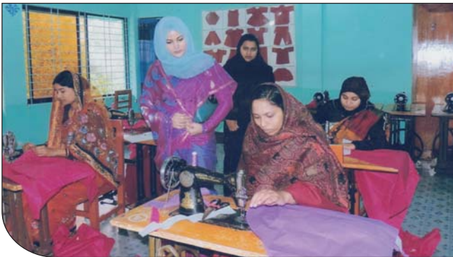
১১ ডিসেম্বর ২০১৪ তারিখে উপ-শাখা সীপকস, কুড়িগ্রাম এর সাধারণ সম্পাদিকা ২০১৪ সালে দ্বিতীয় ব্যাচের দর্জি এবং সুন্দর সূচী বিভাগের ছাত্রীদের ব্যবহারিক পরীক্ষা গ্রহণ করেন।