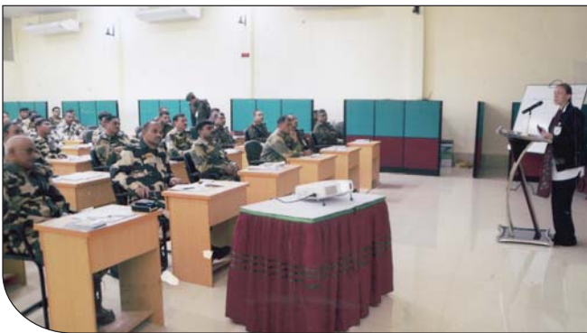
২৮ ডিসেম্বর ২০১৮ তারিখে বিজিটিসিএন্ডএস এর তত্ত্বাবধানে পরিচালিত বিসিএম অফিসার কোর্সে অংশগ্রহণ করেন বিজিবি এবং বিএসএফ এর অফিসারগণ।