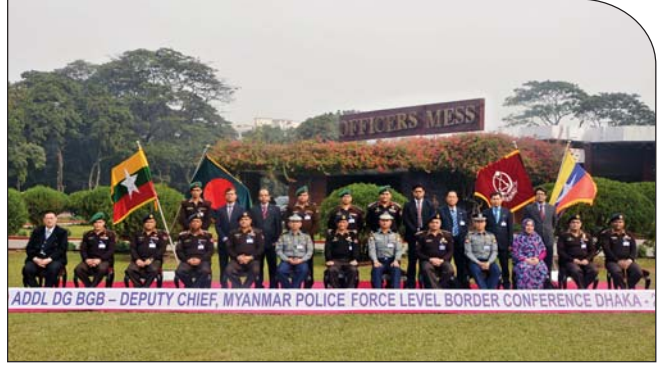
১৭ ডিসেম্বর ২০১৪ তারিখে পিলখানাস্থ অফিসার্স মেসে ফটোসেশনে অংশ গ্রহণ করেন অতিরিক্ত মহাপরিচালক বিজিবি এবং ডেপুটি চিফ অব মায়ানমার পুলিশ।