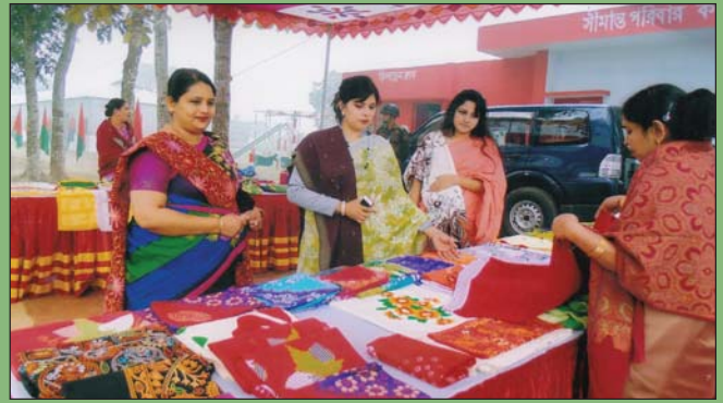
সহ-সভানেত্রী উপ-শাখা সীপকস ময়মনসিংহ উপ-শাখা সীপকস জামালপুর কর্তৃক তৈরীকৃত বিভিন্ন পোশাক-পরিচ্ছদ পরিদর্শন করছেন।