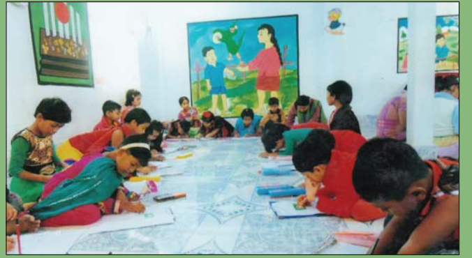
মহান বিজয় দিবস ২০১৪ উদযাপন উপলক্ষে উপ-শাখা সীপকস, জামালপুর চিলড্রেন ক্লাব কর্তৃক আয়োজিত চিত্রাংকন প্রতিযোগিতা।