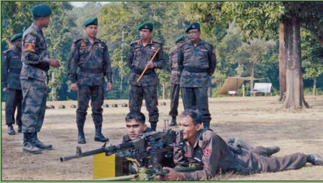
১৮ নভেম্বর ২০১৮ তারিখে বিজিটিসিএন্ডএস এর তত্ত্বাবধানে পরিচালিত এমজি (সিপাহী) কোর্সের প্রশিক্ষার্থীদের প্রশিক্ষণ পরিদর্শন করছেন কমান্ড্যান্ট, বিজিটিসিএন্ডএস।