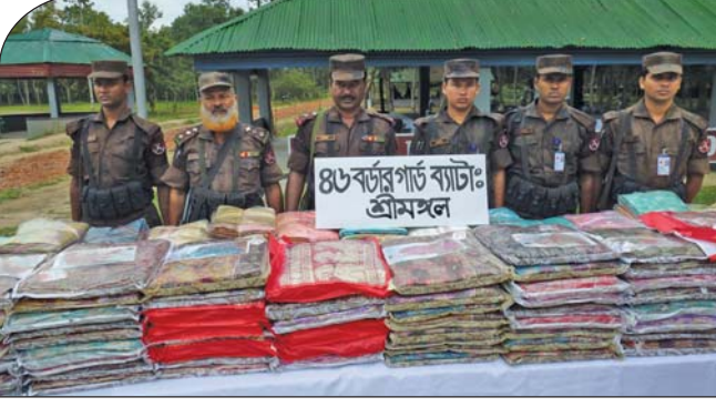
২৬ অক্টোবর ২০১৪ তারিখে ৪৬ বর্ডার গার্ড ব্যাটালিয়নের অধীনস্থ অলীনগর বিওপি'র দায়িত্বপূর্ণ এলাকায় টহল পরিচালনা করে ৩৩,৪১,০০০/- টাকা মূল্যের বিপুল পরিমাণ ভারতীয় শাড়ি আটক করতে সক্ষম হয়।