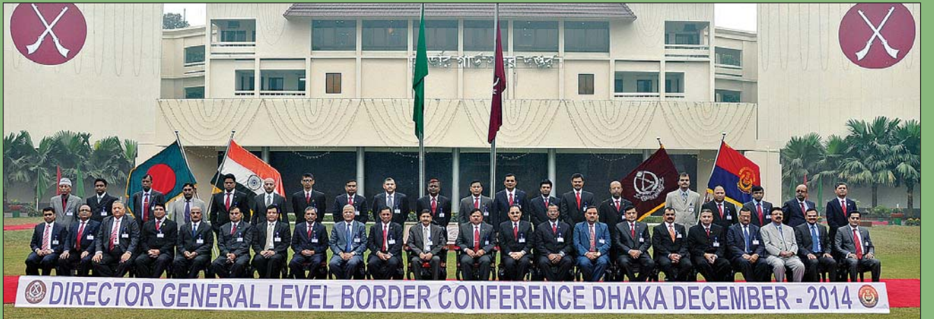
২৬ ডিসেম্বর ২০১৪ তারিখে পিলখানাস্থ বিজিবি সদর দপ্তরে ফটোসেশনে অংশ গ্রহণ করেন বিজিবি ও বিএসএফ এর ডেলিগেশনবন্দ।