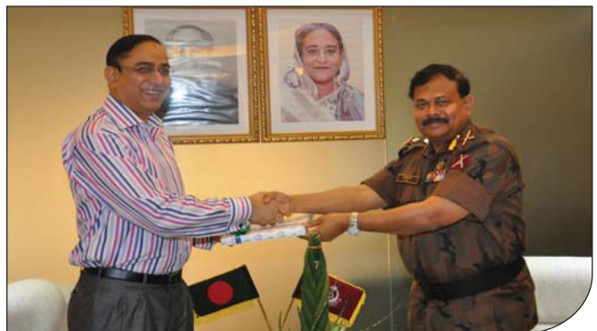
১৯ অক্টোবর ২০১৪ তারিখে পিলখানাস্থ বিজিবি সদর দপ্তরে সৌজন্য সাক্ষাৎ শেষে অতিরিক্ত পুলিশ মহাপরিদর্শককে উপহার প্রদান করেন বিজিবি মহাপরিচালক মেজর জেনারেল আজিজ আহমেদ, বিজিবিএম, পিএসসি, জি।