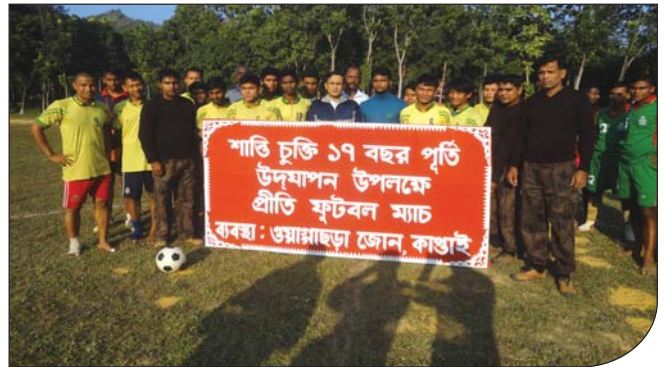
২০ ডিসেম্বর ২০১৪ তারিখে শান্তি চুক্তির ১৭ বছর পূর্তি উদযাপন উপলক্ষে পাহাড়ি জনগণ এবং বিজিবির মধ্যে প্রীতি ফুটবল ম্যাচ অনুষ্ঠিত হয়।