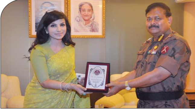
১৬ অক্টোবর ২০১৪ তারিখে বিজিবি মহাপরিচালক মেজর জেনারেল আজিজ আহমেদ, বিজিবিএম, পিএসসি, জি এর সাথে সৌজন্য সাক্ষাৎ করেন পররাষ্ট্র মন্ত্রণালয়ের জাতিসংঘ প্রতিনিধি।