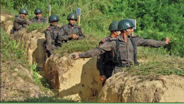
১১ হতে ১৩ নভেম্বর ২০১৪ তারিখ পর্যন্ত থ্রেনেড ফায়ারিং অনুশীলন অনুষ্ঠিত হয়।