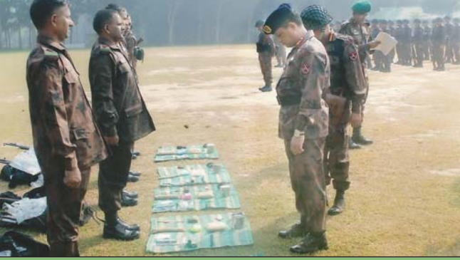
২৫ নভেম্বর ২০১৪ তারিখে কুমিল্লা সেক্টরের বাৎসরিক উপযুক্ততা পরিদর্শন করেন রিজিয়ন কমান্ডার, সরাইল।