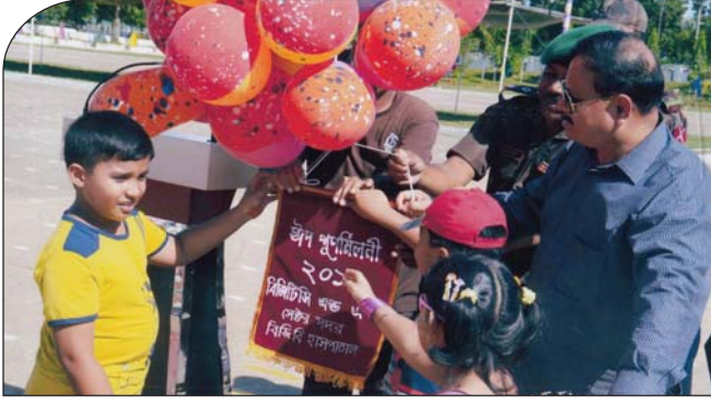
০৮ অক্টোবর ২০১৮ তারিখে বর্ডার গার্ড ট্রেনিং সেন্টার এন্ড স্কুলে ঈদ পুনর্মিলনী অনুষ্ঠান উদ্বোধন করছেন মেজর জেনারেল আজিজ আহমেদ, বিজিবিএম, পিএসসি, জি মহাপরিচালক বর্ডার গার্ড বাংলাদেশ।