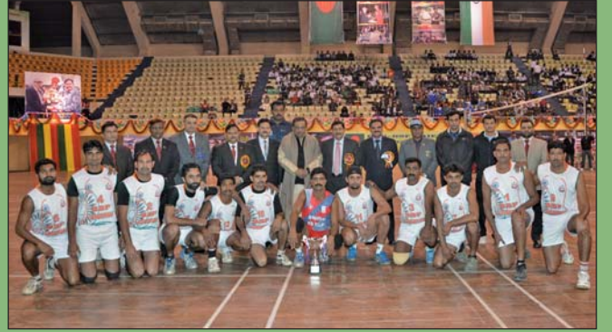
২৫ ডিসেম্বর ২০১৪ তারিখে ঢাকার মিরপুর ইনডোর স্টেডিয়াম এ বিজিবি এবং বিএসএফ এর মধ্যে শ্রীতি ভলিবল ম্যাচ শেষে বিএসএফ দলের সাথে মাননীয় স্বরাষ্ট্র প্রতিমন্ত্রী আসাদুজ্জামান খান কামাল, এমপি ও বিজিবি মহাপরিচালক।