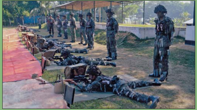
১০ ডিসেম্বর ২০১৮ তারিখে বিজিটিসিএন্ডএস এর তত্ত্বাবধানে পরিচালিত স্নাইপার (সিপাহী) কোর্সের প্রশিক্ষার্থীদের ফায়ারিং অনুশীলন।