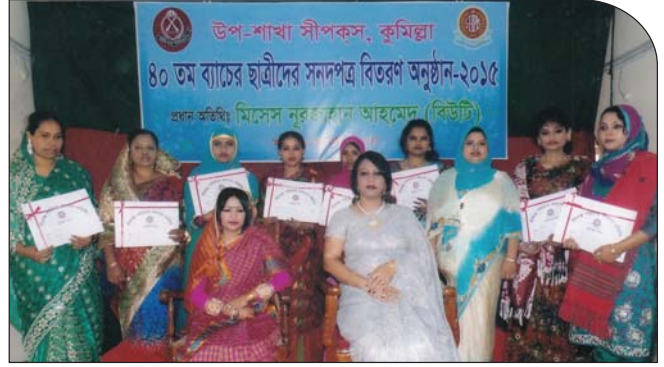
৪০ তম ব্যাচের ছাত্রীদের সনদপত্র বিতরণ অনুষ্ঠানে সহ-সভানেত্রী উপ-শাখা সীপকস, কুমিল্লা।