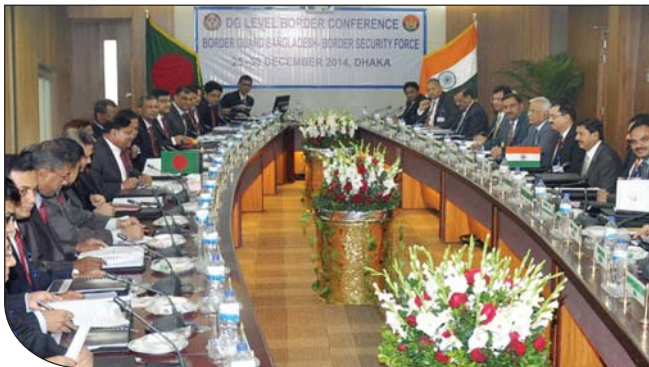
২৬ ডিসেম্বর ২০১৪ তারিখে বিজিবি সদর দপ্তরে বিজিবি-বিএসএফ মহাপরিচালক পর্যায়ে সীমান্ত সম্মেলন অনুষ্ঠিত হয়।