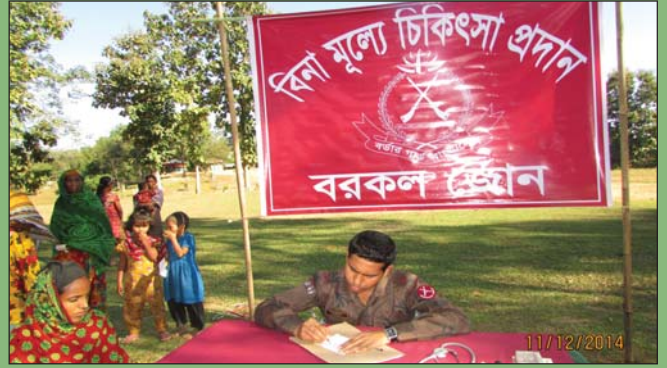
'সম্প্রীতি ও উন্নয়ন' কর্মসূচির আওতায় চিকিৎসা সহায়তা প্রদান করছেন মেডিক্যাল অফিসার, ২২ বর্ডার গার্ড ব্যাটালিয়ন।