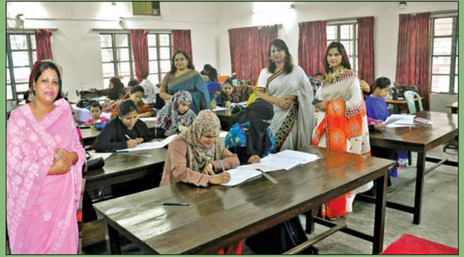
২০১৪ সালের দর্জি ও সুন্দর সূচী বিভাগের ২য় ব্যাচের চূড়ান্ত লিখিত পরীক্ষা পরিদর্শন করেন প্রধান পৃষ্ঠপোষক কেন্দ্রীয় সীপকস, ঢাকা।