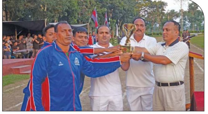
১৬ অক্টোবর ২০১৪ তারিখে শ্রীমঙ্গল সেক্টর আন্তঃব্যাটালিয়ন এ্যাথলেটিক্স প্রতিযোগিতায় চ্যাম্পিয়ন ৪৬ বর্ডার গার্ড ব্যাটালিয়নকে ট্রফি প্রদান করছেন সেক্টর কমান্ডার, শ্রীমঙ্গল।