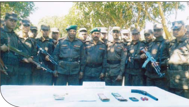
১৪ ডিসেম্বর ২০১৪ তারিখে ২১ বর্ডার গার্ড ব্যাটালিয়নের অধীনস্থ অলিন্দ্র কারবারি পাড়া এলাকায় টহল পরিচালনা করে ০২ রাউন্ড গুলিসহ ০১টি শাটার গান উদ্ধার করে।