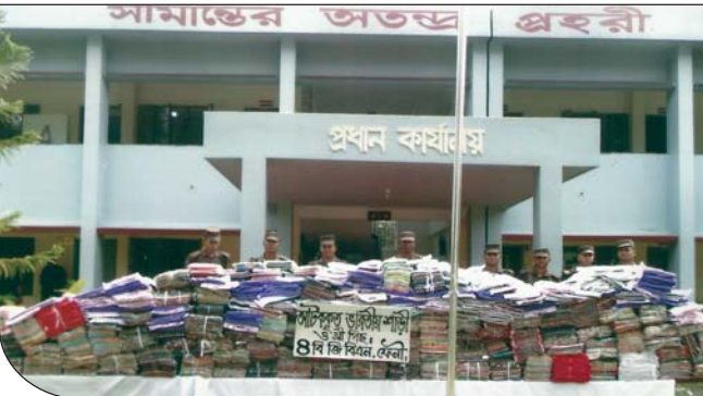
০৮ অক্টোবর ২০১৪ তারিখে ৪ বর্ডার গার্ড ব্যাটালিয়নের অধীনস্থ অলীনগর বিওপি'র টহল দল শুভপুর ব্রিজের নিকট অভিযান পরিচালনা করে ৪৩,৯২,৫০০/- টাকা মূল্যের বিভিন্ন প্রকার ভারতীয় শাড়ি ও প্রি পিস আটক করে।