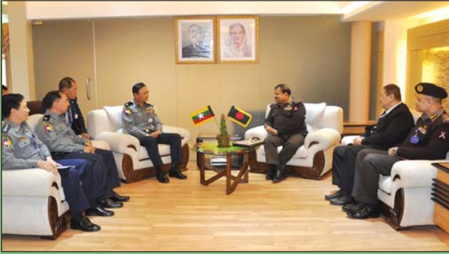
১৭ ডিসেম্বর ২০১৪ তারিখে বিজিবি মহাপরিচালক মেজর জেনারেল আজিজ আহমেদ, বিজিবিএম, পিএসসি, জি এর সাথে সৌজন্য সাক্ষাৎ করেন ডেপুটি চিফ অব পুলিশ, মায়ানমার।