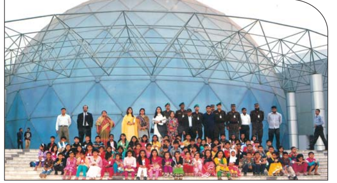
২০১৪ সালের সীপকস, চিলড্রেন ক্লাব কর্তৃক চিলড্রেন ক্লাবের ছাত্র-ছাত্রীদের শিক্ষা সফর হিসেবে বঙ্গবন্ধু শেখ মুজিবুর রহমান নভোথিয়েটার পরিদর্শন।