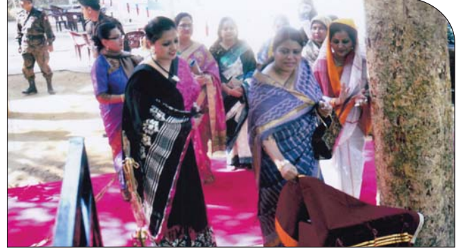
২৩ ডিসেম্বর ২০১৪ তারিখে উপ-শাখা সীপকস, বিজিটিসিএন্ডএস এর সীমান্তিক বুটিক এন্ড বিউটি পার্লার এর শুভ উদ্বোধন করেন প্রধান পৃষ্ঠপোষক, কেন্দ্রীয় সীপকস।