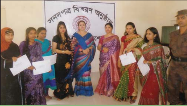
০৯ ডিসেম্বর ২০১৪ তারিখে শাখা-সীপকস, যশোরে ছাত্রীদের মাঝে সনদপত্র বিতরণ অনুষ্ঠানে সভানেত্রী, শাখা সীপকস, যশোর।