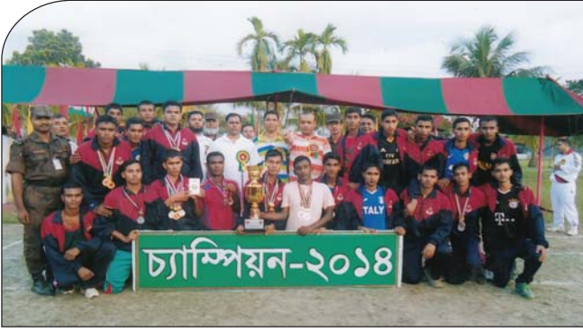
২৩ অক্টোবর ২০১৪ তারিখে আন্তঃব্যাটালিয়ন অ্যাথলেটিক্স প্রতিযোগিতায় ১১ বর্ডার গার্ড ব্যাটালিয়ন, নেত্রকোনা চ্যাম্পিয়ন হওয়ার গৌরব অর্জন করে।