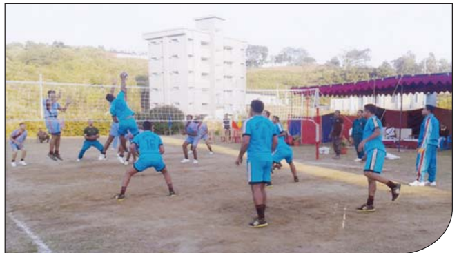
২০ ডিসেম্বর ২০১৪ তারিখে বিজিবি দিবস উপলক্ষে রিজিয়ন সদর দপ্তর, গুইমারা (বাংলাদেশ সেনাবাহিনী) এবং বিজিবি সেক্টর সদর দপ্তর গুইমারা এর মধ্যে শ্রীতি ভলিবল ম্যাচ অনুষ্ঠিত হয়।