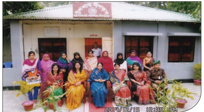
১৫ ডিসেম্বর ২০১৪ তারিখে সভানেত্রী, শাখা সীপকস, যশোর কর্তৃক উপ-শাখা সীপকস, নীলডুমুর পরিদর্শনকালীন ধারণকৃত ছবি।