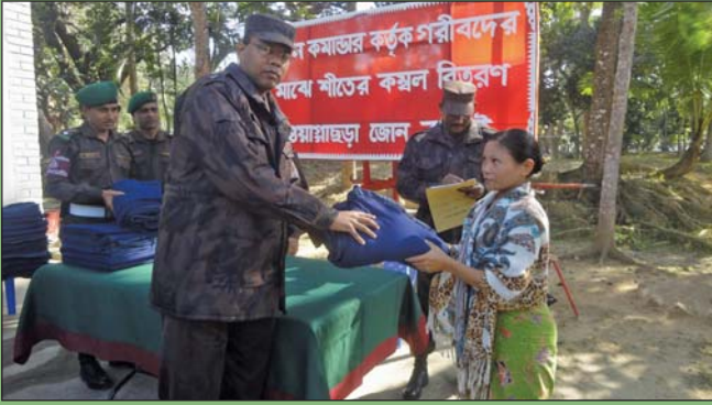
২৮ ডিসেম্বর ২০১৪ তারিখে স্থানীয় গরীব ও দুস্থদের মাঝে কমল বিতরণ করছেন জোন কমান্ডার, ওয়ান্সাছড়া জোন।