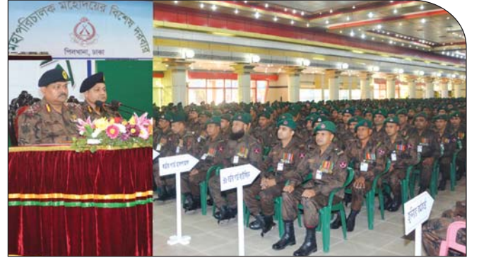
২১ ডিসেম্বর ২০১৪ তারিখে পিলখানাস্থ বীর উত্তম ফজলুর রহমান খন্দকার মিলনায়তনে দরবার নিচ্ছেন বিজিবি মহাপরিচালক মেজর জেনারেল আজিজ আহমেদ, বিজিবিএম, পিএসসি, জি।