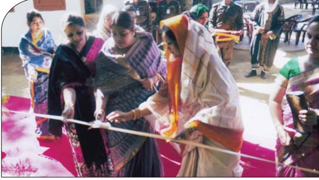
২৩ ডিসেম্বর ২০১৪ তারিখে উপ-শাখা সীপকস, বিজিটিসিএন্ডএস এর সীমান্তিক বুটিক এন্ড বিউটি পার্লার এর শুভ উদ্বোধন করেন প্রধান পৃষ্ঠপোষক, কেন্দ্রীয় সীপকস।