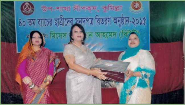
দর্জি শিক্ষিকাকে পুরস্কার প্রদান করছেন সহ-সভানেত্রী উপ-শাখা সীপকস, কুমিল্লা।