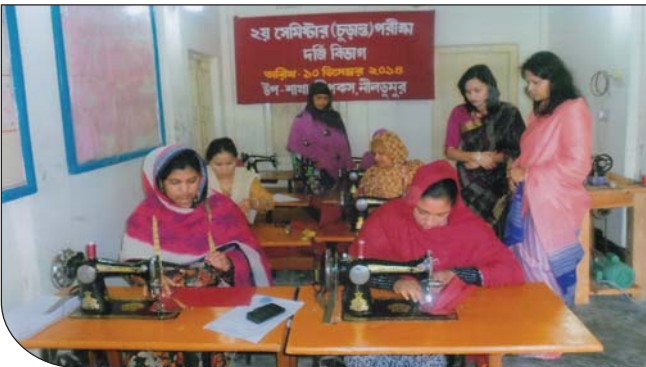
১০ ও ১১ ডিসেম্বর ২০১৪ তারিখে সাধারণ সম্পাদিকা, উপ-শাখা সীপকস, নীলডুমুর কর্তৃক দর্জি বিভাগের ২য় ব্যাচের চূড়ান্ত পরীক্ষা এবং কম্পিউটার চূড়ান্ত পরীক্ষা পরিদর্শনকালীন ধারণকৃত ছবি।