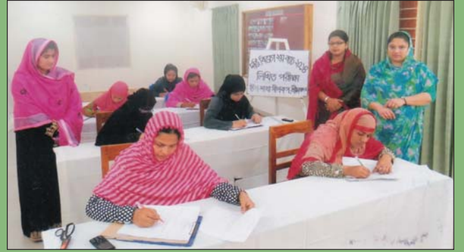
০৯ ডিসেম্বর ২০১৪ তারিখে দর্জি বিভাগ ২য় ব্যাচ ২য় সেমিস্টার এ লিখিত পরীক্ষা পরিদর্শন করছেন সহ-সভানেত্রী উপ-শাখা সীপকস, শ্রীমঙ্গল।