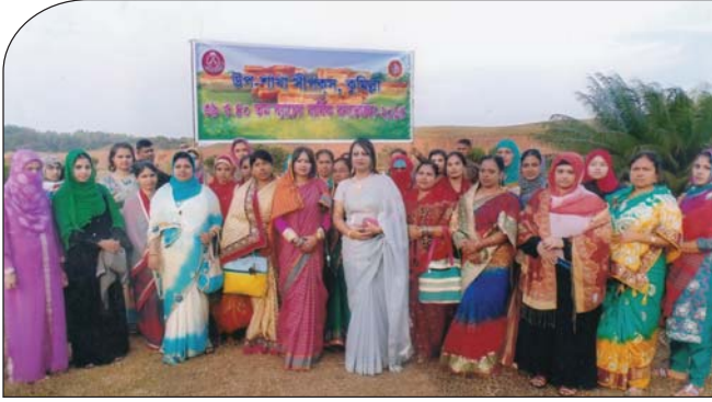
৩৯ ও ৪০ তম ব্যাচের ছাত্রীদের বার্ষিক বনভোজন-২০১৫ অনুষ্ঠানে সহ-সভানেত্রী ও কোষাধ্যক্ষ উপ-শাখা সীপকস, কুমিল্লা।