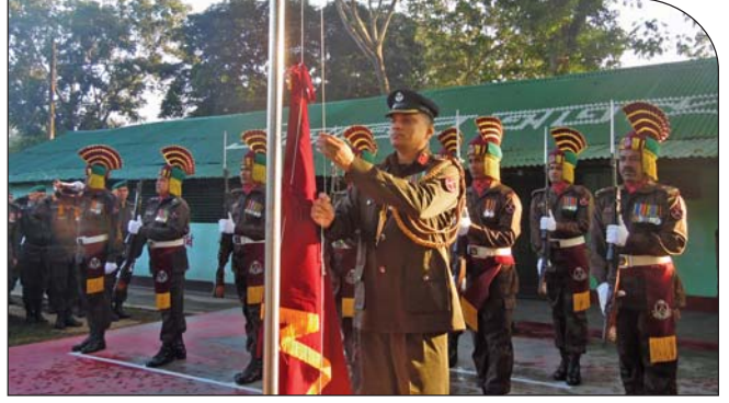
২০ ডিসেম্বর ২০১৪ তারিখে বিজিবি দিবস উপলক্ষে পতাকা উত্তোলন করেন অধিনায়ক, ৪০ বর্ডার গার্ড ব্যাটালিয়ন।