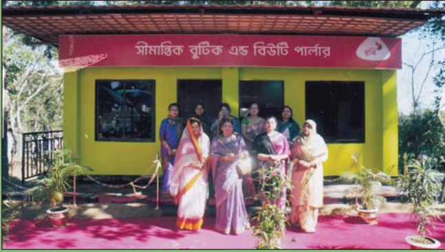
২৩ ডিসেম্বর ২০১৪ তারিখে উপ-শাখা সীপকস, বিজিটিসিএন্ডএস এর সীমান্তিক বুটিক এন্ড বিউটি পার্লার এর শুভ উদ্বোধন শেষে প্রধান পৃষ্ঠপোষক, কেন্দ্রীয় সীপকস ফটোসেশনে অংশগ্রহণ করেন।