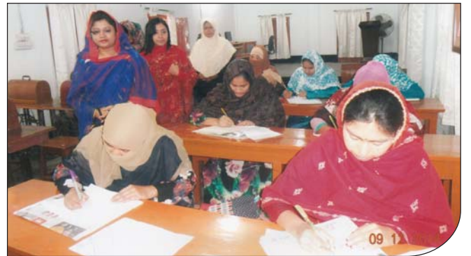
০৯ ডিসেম্বর ২০১৪ তারিখে উপ-শাখা সীপকস, রাজশাহী দর্জি বিভাগের পরীক্ষা চলাকালীন পরিদর্শন করছেন সহ-সভানেত্রী, উপ-শাখা সীপকস, রাজশাহী।