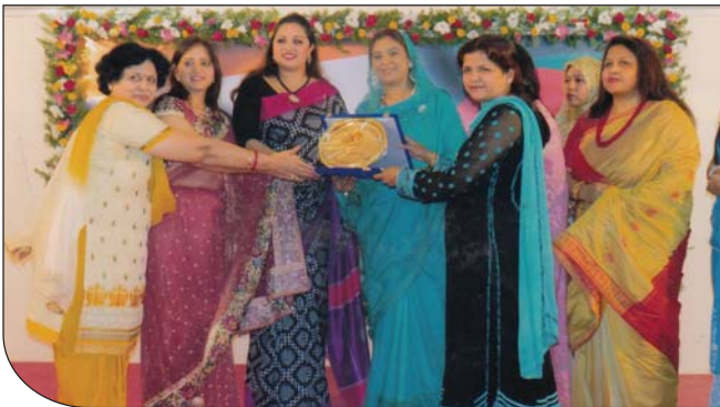
১৭ ডিসেম্বর ২০১৪ তারিখে উপ-শাখা সীপকস, সিলেট কর্তৃক আয়োজিত সাংস্কৃতিক অনুষ্ঠান শেষে সভানেত্রী ও সহ-সভানেত্রীর হাতে ক্রেস্ট তুলে দিচ্ছেন আইজি বিএসএফ ম্যাডাম।