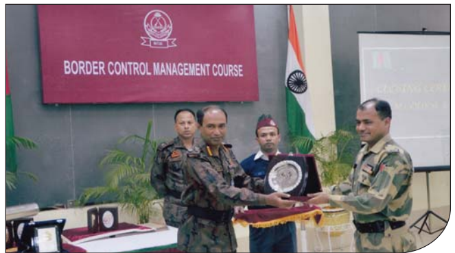
বিএসএফ এবং বিজিবি অফিসার সমন্বয়ে পরিচালিত বিসিএম অফিসার কোর্স শেষে ফ্রেস্ট প্রদান করেছেন কমান্ড্যান্ট বিজিটিসিএন্ডএস।