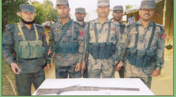
২৫ নভেম্বর ২০১৪ তারিখে ২১ বর্ডার গার্ড ব্যাটালিয়নের অধীনস্থ বান্দরসিং বিওপি'র টহলদল ০৮ রাউন্ড গুলিসহ ০১টি পাইপগান উদ্ধার করে।