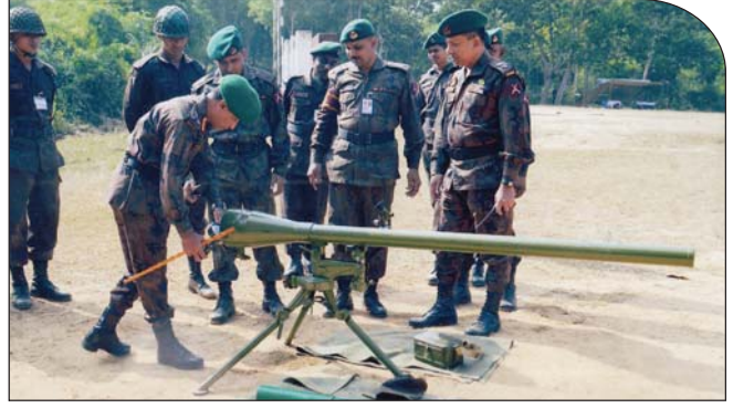
২৬ নভেম্বর ২০১৮ তারিখে বিজিটিসিএন্ডএস এর তত্ত্বাবধানে পরিচালিত এন্টি ট্যাংকে গ্রেড ১ ও গ্রেড ২ কোর্সের অস্ত্র পরিদর্শন করছেন কমান্ড্যান্ট, বিজিটিসিএন্ডএস।