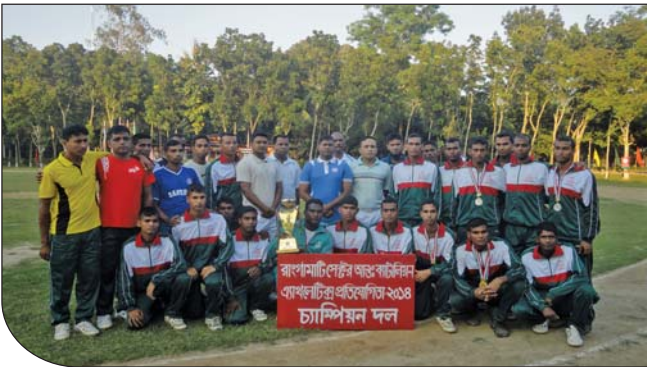
১৯ ডিসেম্বর ২০১৪ তারিখে রাঙ্গামাটি সেক্টর আন্তঃব্যাটালিয়ন অ্যাথলেটিক্স প্রতিযোগিতা-২০১৪ এর চ্যাম্পিয়ন ১৯ বর্ডার গার্ড ব্যাটালিয়ন দলের সাথে ভারপ্রাপ্ত সেক্টর কমান্ডার, বিজিবি রাঙ্গামাটি।