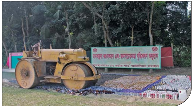
০২ ডিসেম্বর ২০১৪ তারিখে ১২ বর্ডার গার্ড ব্যাটালিয়নের ব্যবস্থাপনায় মাদকদ্রব্য ধ্বংসকরণ এবং জনসচেতনতা বৃদ্ধিকরণ অনুষ্ঠানে বিপুল পরিমাণ মাদক দ্রব্য ধ্বংস করা হয়।