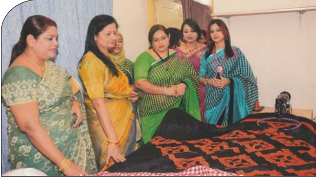
২৬ ডিসেম্বর ২০১৪ তারিখে বাওয়া ডেলিগেশন দল কেন্দ্রীয় সীপকস এর অ্যামব্রেডারি রুম পরিদর্শন করেন।