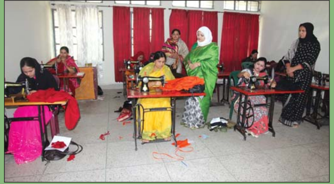
১০ ডিসেম্বর ২০১৪ তারিখে ২য় ব্যাচ দর্জি বিভাগের কাটিং পরিদর্শন করেন সাধারণ সম্পাদিকা ও কোষাধ্যক্ষ উপ শাখা সীপকস, চুয়াডাঙ্গা।