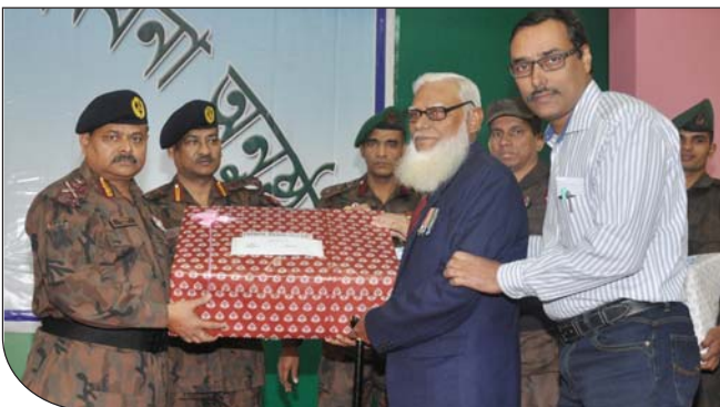
২১ ডিসেম্বর ২০১৪ তারিখে পিলখানাস্থ বীর উত্তম ফজলুর রহমান খন্দকার মিলনায়তনে খেতাবপ্রাপ্ত মুক্তিযোদ্ধাদের সংবর্ধনা অনুষ্ঠানে উপহার প্রদান করছেন বিজিবি মহাপরিচালক মেজর জেনারেল আজিজ আহমেদ, বিজিবিএম, পিএসসি, জি।