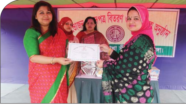
২০১৪ সালে দর্জি বিভাগের ২য় ব্যাচে সনদপত্র প্রদান করছেন সহ-সভানেত্রী, সাথে সাধারণ সম্পাদিকা ও কোষাধ্যক্ষ, উপ-শাখা সীপকস, চুয়াডাঙ্গা।