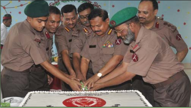
১৫ অক্টোবর ২০১৪ তারিখে বর্ডার গার্ড হাসপাতালের ৬৭ তম প্রতিষ্ঠা বার্ষিকীতে কেক কাটছেন বিজিবি মহাপরিচালক মেজর জেনারেল আজিজ আহমেদ, বিজিবিএম, পিএসসি, জি।