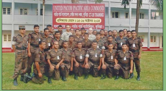
১৫ হতে ১৬ অক্টোবর ২০১৪ তারিখে ১০ বর্ডার গার্ড ব্যাটালিয়নের ব্যবস্থাপনায় UNITED PACOM (PACIFIC AREA COMMAND) CT-30 কোর্স অনুষ্ঠিত হয়।