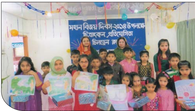
১৬ ডিসেম্বর ২০১৪ তারিখে মহান বিজয় দিবস উপলক্ষে চিত্রাংকন প্রতিযোগিতায় পুরস্কার বিতরণ শেষে চিলড্রেন ক্লাবের ছাত্র-ছাত্রীদের মাঝে সহ-সভানেত্রী উপ-শাখা সীপকস শ্রীমঙ্গল।