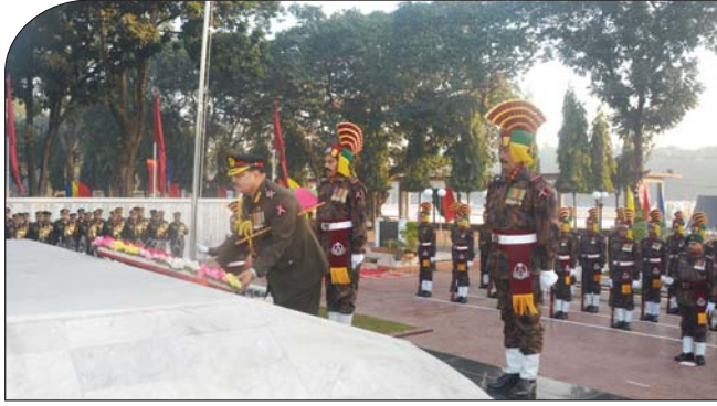
২০ ডিসেম্বর ২০১৪ তারিখে বিজিবি দিবস উপলক্ষে পিলখানাস্থ সীমান্ত গৌরবে পুষ্পস্তবক অর্পণ করেন বিজিবি মহাপরিচালক মেজর জেনারেল আজিজ আহমেদ, বিজিবিএম, পিএসসি, জি।