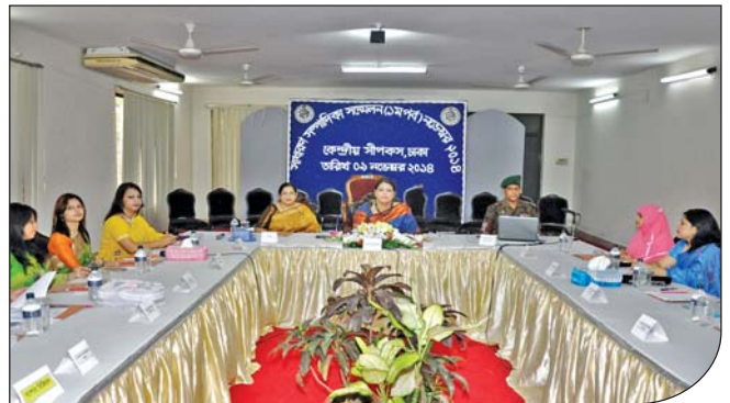
০৯ নভেম্বর ২০১৪ সালের সাধারণ সম্পাদিকা সম্মেলন (১ম পর্ব) কেন্দ্রীয় সীপকস এর হল রুমে অনুষ্ঠিত হয়।